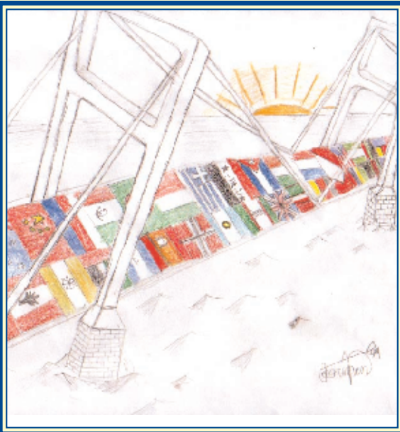
— рисунок учащегося шестого класса Джэрмена Карра (муниципальная школа PS 137, учебный округ 5), победителя конкурса 2004 г. на лучший логотип для программы ELL "Bridges to Excellence"